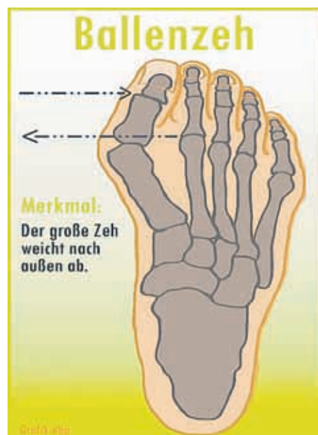
Schematische Darstellung eines Ballenzehs. (Grafik: dbp)