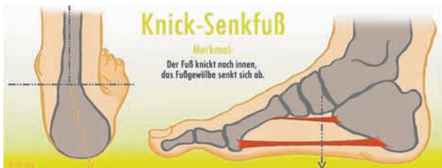
Schematische Darstellung eines Knick-Senkfußes.

An der Dorfau 8 Tel.: 033703 / 76 33 Fernneuendorf Fax: 033703 / 6 85 30 15838 Am Mellensee