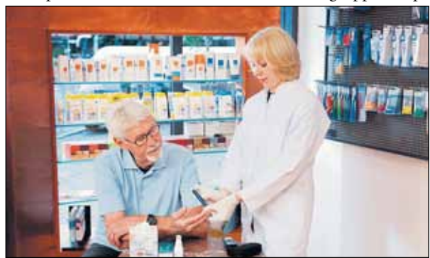
Apotheken bieten neben der Blutzuckermessung verschiedenen Dienstleistungen wie Ernährungsberatung an.

Ein dauerhaft erhöhter Fink: "Neben der Blutzucker Blutzucker schadet den Blutzucker-Kontrollmessung bieten Gefäßen, was zu Nierenschäden bis hin zum Nierenversagen Dienstleistungen rund um führen kann. Apotheker Diabetes an. Das reicht von empfehlen deshalb, einmal Einnahmehinweisen über Ernährungsjährlich die Blutzuckerwerte bis zur Vermittlung passender Sport- kontrollieren zu lassen. Stellt oder Selbsthilfegruppen. ipr