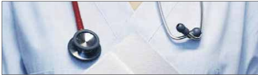
Diagnose bleibt Sache des Arztes.

Zunächst erhält jede Krankenkasse für jeden Versicherten eine Grundpauschale in Höhe der durchschnittlichen Pro-Kopf-Ausgaben in der gesetzlichen Krankenversicherung (GKV). Für eine Krankenkasse mit vielen alten und kranken Versicherten reicht