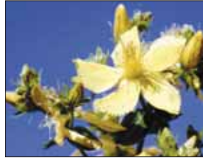
Johanniskraut als Wirkstoff

Eines der schwerwiegendsten Symptome von Neurodermitis ist der fast immer vorhandene, entzündungsbedingte Juckreiz. Als ein Mittel der Wahl gilt heute der natürliche Wirkstoff des Johanniskrauts, Hyperforin. Eingebettet in eine moderne, nicht fettende Pflegecreme, verbessert Hyperforin nicht nur die natürliche Widerstandsfähigkeit der Haut, sondern wirkt zugleich auf schonende Art ausgeprägt antibakteriell und antientzünd-