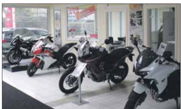
Unter anderem der Ausstellungsraum des Zweiradhauses wurde neu gestaltet.

Beim Honda-Händler „Bikeshop K&W“ in Plate wurde am vergangenen Sonnabend Saisonöffnung gefeiert. Gleichzeitig stellten die Mitarbeiter die neuen und umgestalteten Räume des Motorradhauses vor. Im Mittelpunkt standen jedoch die Zweiräder.