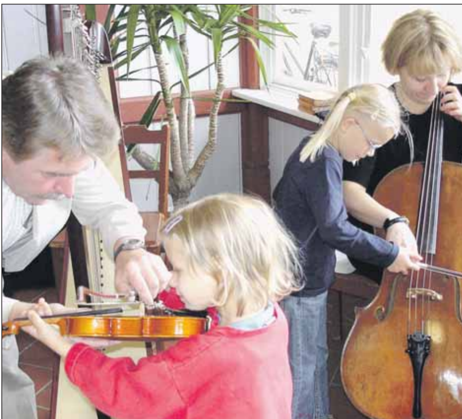
Beim Tag der offenen Tür im Konservatorium können auch die jüngsten Musikbegeisterten Instrumente anschauen und ausprobieren.

Musikschule lädt am 14. Mai zu sich ein/Astor-Piazzolla-Programm am 6. Mai