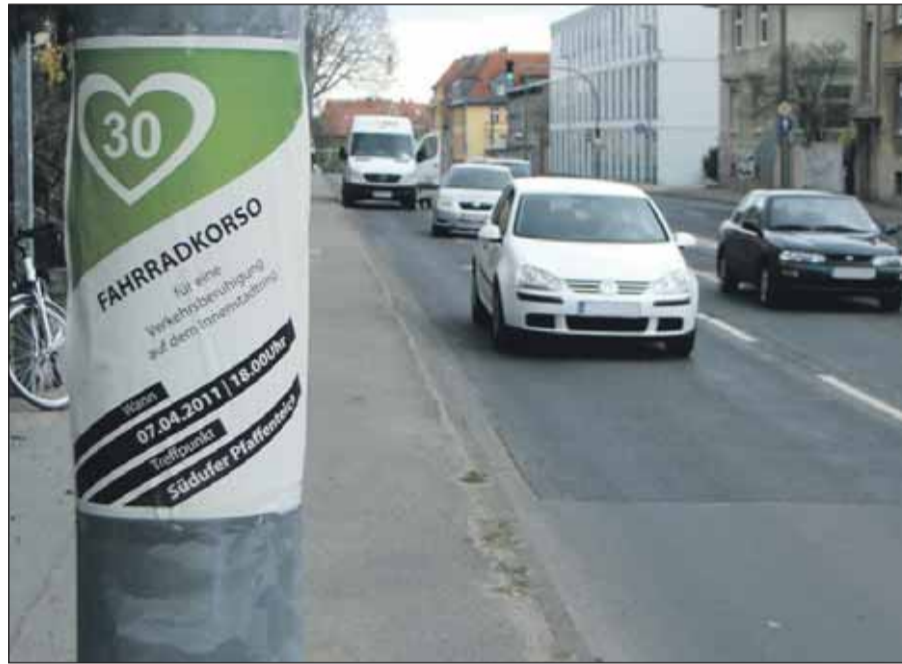
Ein Herz für Tempo 30 zeigt wohl höchstens ein Viertel der Schweriner.

Das offizielle Verkehrszeichen für die Höchstgeschwindigkeit von 30 km/h ist jedoch kein Herz, sondern ein sachlicher roter Kreis mit der schwarzen 30 drin. Und das soll künftig an allen Straßen stehen, die den so genannten innerstädtischen Ring bilden, also auch auf dem Obotritenring, in der Knaudtstraße und am Ostorfer Ufer, ergänzt durch die Robert-Beltz-Straße. So wünschte sich's die Stadtverwaltung.