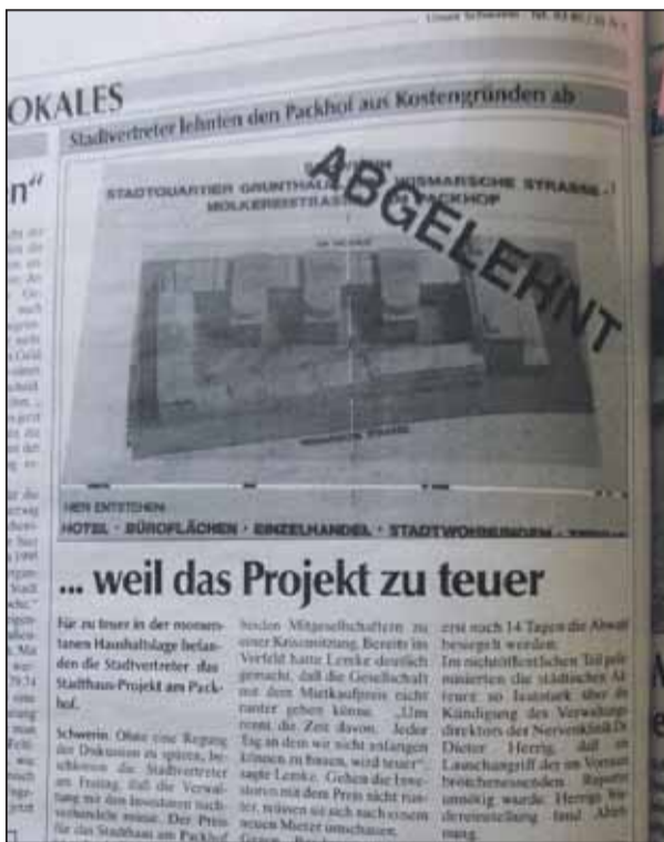
Artikel in „Unser Schwerin“ vom Frühjahr 1996.

Warum nicht gleich so?, möchte man fragen, schließlich wurden die entsprechenden Dokumente seinerzeit (im Juni 1996) in öffentlicher Stadtvertretung behandelt. Vorangegangen waren dieser Sitzung Diskussionen darüber, ob die Stadt sich den Neubau eines 100 Millionen Mark teuren Stadthaus leisten kann – oder ansonsten die „kleinere Variante“ für 80 Millionen Mark. Alternativen wurden kaum in