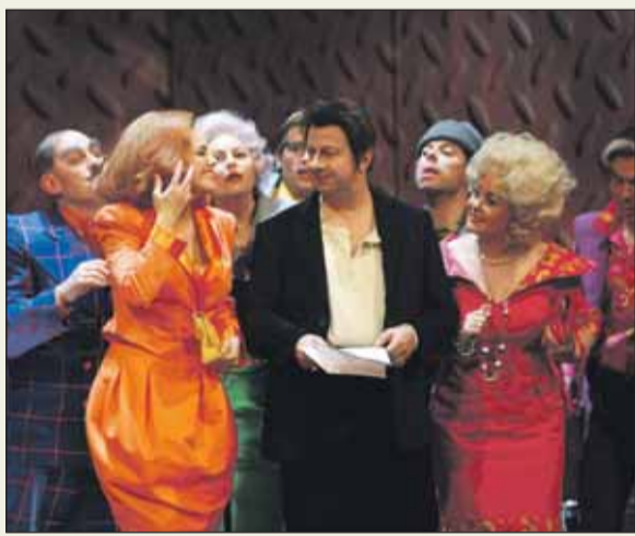
Szene aus Giacomo Puccinis Oper „Gianni Schicchi“, in der es mitunter virtuos zugeht.

Die spezifische Klangsprache, die er zur Schilderung der extremen Emotionalität Judiths und Blaubarts entwickelt, ist von einem überwältigenden Farbenreichtum –