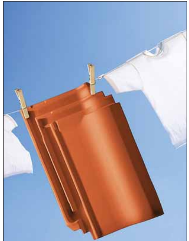
Schluss mit schmutzig: Der Erlus-Lotus-Tondachziegel mit Selbstreinigungsfunktion.

Dank einer selbstreinigenden Oberflächenveredelung sieht ein Dach, das mit dem Erlus-Lotus-Tondachziegel eingedeckt ist, auch nach Jahren sauberer aus, im Vergleich zu herkömmlichen Dachziegeln. Die Veredelung wird in die Oberfläche eingebrannt und sorgt dafür, dass organische Schmutzteilchen – wie Fettab-