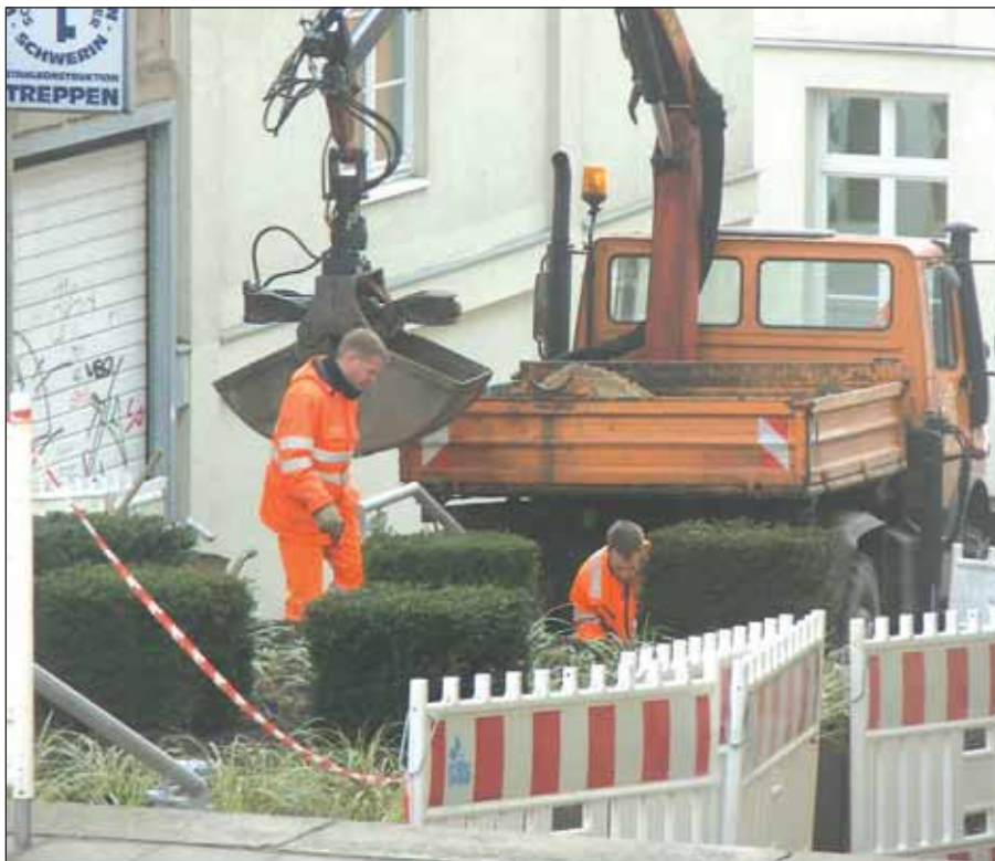
Nicht nur Schmutzdecken werden in diesen Tagen beseitigt, es wird – wie hier durch die SDS in der Moritz-Wiggers-Straße – auch noch die eine oder andere grüne Oase geschaffen.

Wer sich am Frühjahrsputz beteiligen möchte, kann sich bei der SDS unter der Telefonnummer 03 85 / 6 33 16 71 anmelden. nh