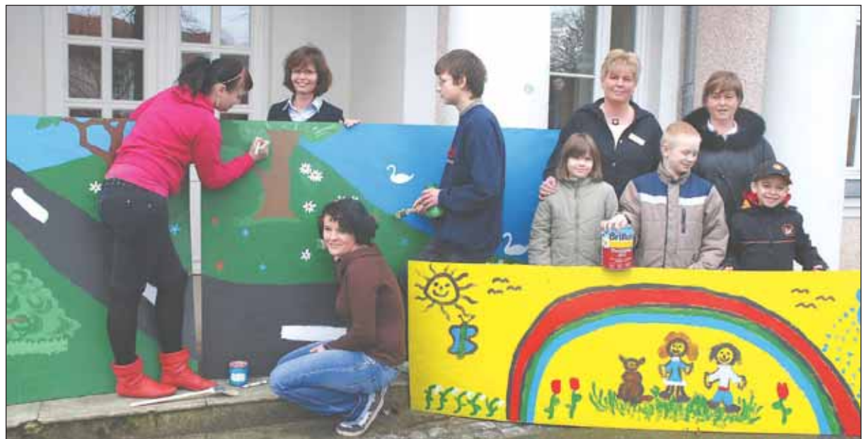
Fröhlich sind große und kleine Künstler zu Werke gegangen – und entsprechend fröhlich wirkt denn auch das Ergebnis.

gesklinik) und kann sich im wahrsten Sinne des Wortes sehen lassen.