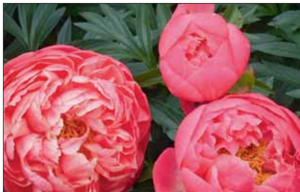
Für eine solche Blütenpracht braucht's etwas Vorsorge.

Besonders die Echte Pfingstrose ist eine verhältnismäßig robuste Gartenpflanze, und das gilt auch für viele der Zuchtsorten der Chinesischen Pfingstrose. Die anderen Arten stellen an ihren Standort höhere Anforderungen und können vor allem durch Spätfröste Schaden an Blättern und Trieben nehmen. Sinnvoll ist es, Pfingstrosen möglichst lange an einem Standort stehen zu lassen, da der Blütenansatz von Jahr zu Jahr zunimmt. Pfingst-