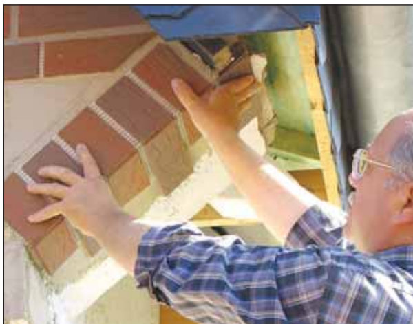
Vorher klären, was es nachher kostet.

Anders sieht es aus, wenn es sich bei dem Kostenvoranschlag ausdrücklich um einen „verbindlichen Kostenvoranschlag“ handelt. Dann müssen Angebotssumme und Rechnungssumme übereinstimmen. Doch auch diese Sache hat ihren Haken: Lässt sich der Handwerker auf einen Festbetrag ein, kalkuliert er nicht selten „mit Luft“, sprich: Er berechnet mehr als nötig, um einen finanziellen Spielraum zu haben.