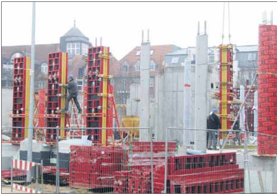
Auf der Baustelle wird gegen die Zeit gearbeitet – ein Sieg ist nicht in Sicht.