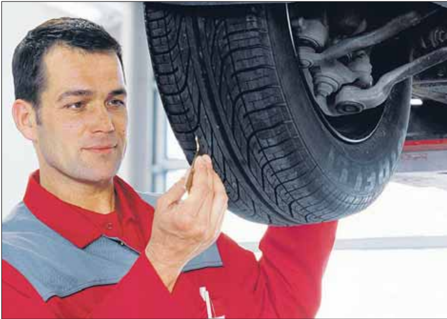
Auch Sommerpneus brauchen Profil.

Kampagne zur Verkehrssicherheit hat begonnen