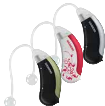
Die attraktiven Farben und Muster von „Life“