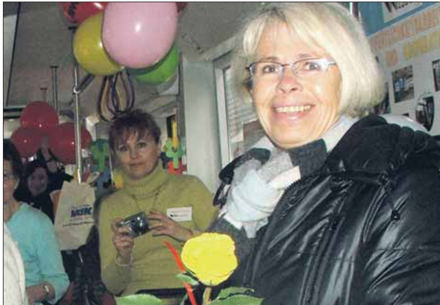
Oberbürgermeisterin Angelika Gramkow fuhr mit der „Frauen-Power-Bahn“.

Das Motto „Frauen auf dem richtigen Gleis“ gilt jedoch nicht nur für die Bahnfahrt, sondern im Prinzip auch für die weiteren Aktionen zum Frauentag. So findet zum Beispiel am heutigen Sonnabend im „Rittersaal“ von 15 bis 17 Uhr ein Konzert statt, das unter anderem vom Projekt „Pluralität im interkulturellen Dialog“ der Landesregierung gefördert wird und den interna-