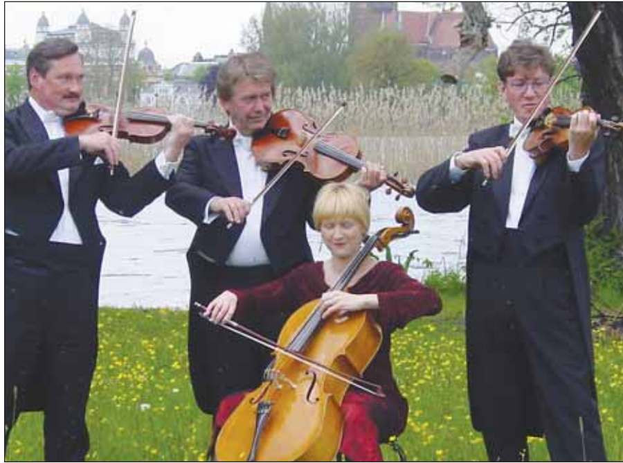
„Deutsche Streichquartette“ zu Ehren von Joseph Haydn und Felix Mendelssohn-Bartholdy spielt das Rosenbusch-Quartett heute ab 17.30 Uhr im Schloss.