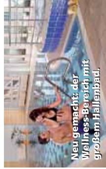
Neu gemacht: der Wellness-Bereich mit großem Hallenbad.