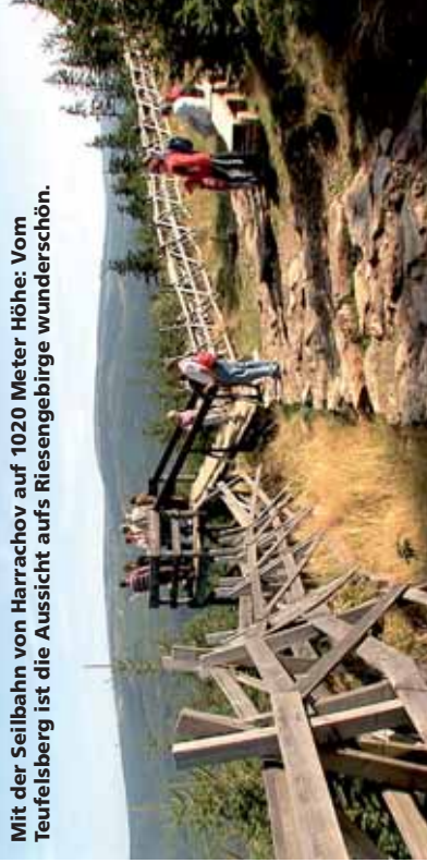
Mit der Seilbahn von Harrachov auf 1020 Meter Höhe: Vom Teufelsberg ist die Aussicht aufs Riesengebirge wunderschön.