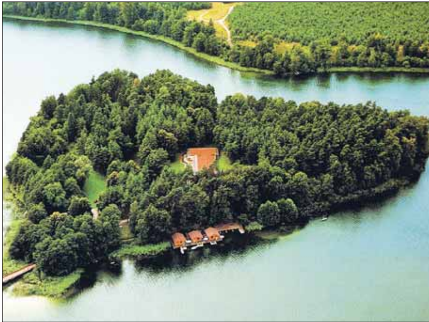
Hier zeigt man Herz: Herzinsel im Brückentensee, Inselhotel Brückentensee.

Auch im Schlosspark in Mirow in der Mecklenburgischen Seenplatte gibt es eine Liebesinsel. Eine romantische