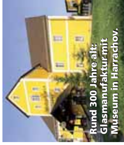
Rund 300 Jahre alt: Glasmanufaktur mit Museum in Harrachov.