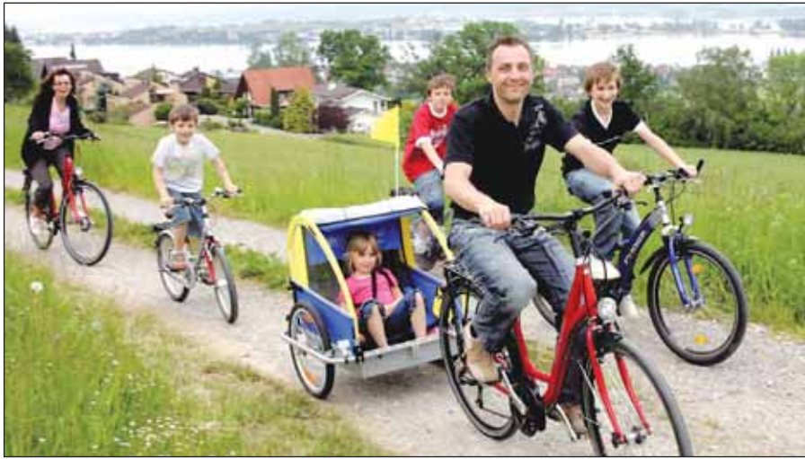
Familienurlaub auf dem Fahrrad – warum nicht?

Die klassischen Bodensee-Touren führen zu mittelalterli-