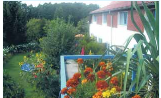
Blick von einer Terrasse hinunter zu den Ferienwohnungen und dem Garten.