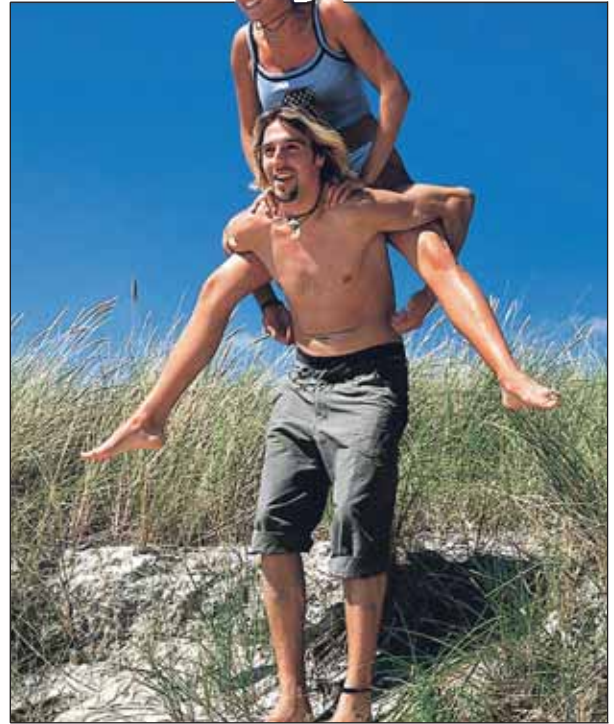
Insel Fehmarn: ein Urlaubsparadies.

Weitere Informationen zum Urlaubsziel Fehmarn erhält man telefonisch unter der Rufnummer 0 43 71 / 50 63 33, ansonsten aber auch im Internet: „www.fehmarn.de“. bbs/mn