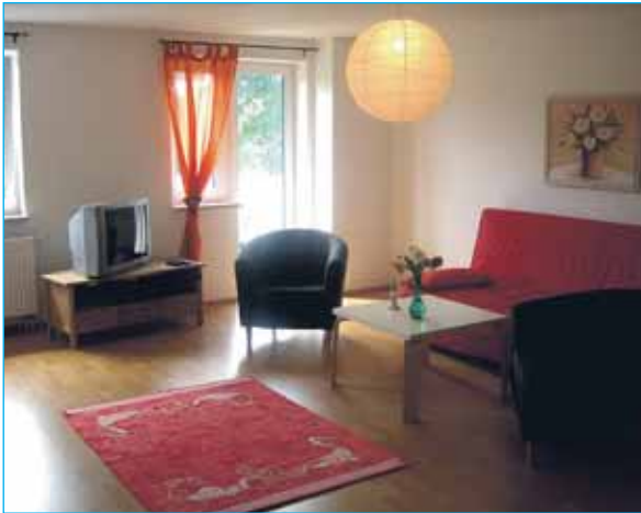
Die Ferienwohnungen sind alle unterschiedlich gestaltet. Dies ist eines der Wohnzimmer.

Gebucht werden können die großzügig und freundlich gestalteten Ferienwohnungen je nach Ausstattung ab 45 Euro pro Nacht: bei Familie Decker in Röddelin unter Telefon 0 39 87 / 33 37 oder 01 52 / 02 00 56 94.