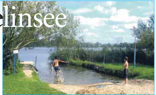
Im Sommer bei den kleinen Gästen beliebt: der eigene „Strand“.