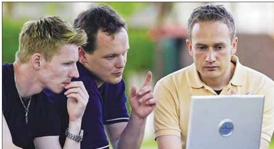
Arbeiten und sich gleichzeitig wie im Urlaub fühlen ...

Auch und gerade im Tagungssegment stimmt in den Jugendherbergen das Preis-Leistungs-Verhältnis. In M-V mit seinen weiten Landschaften, urwüchsigen Naturparks und frischen Küstenwelten hilft auch noch die Umgebung beim Ideensammeln und Kräftetanken.