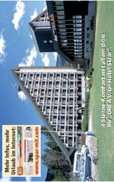
4 Sterne-Komfort mit allem drin: Ihr „OREA Vital Hotel Sklář“.