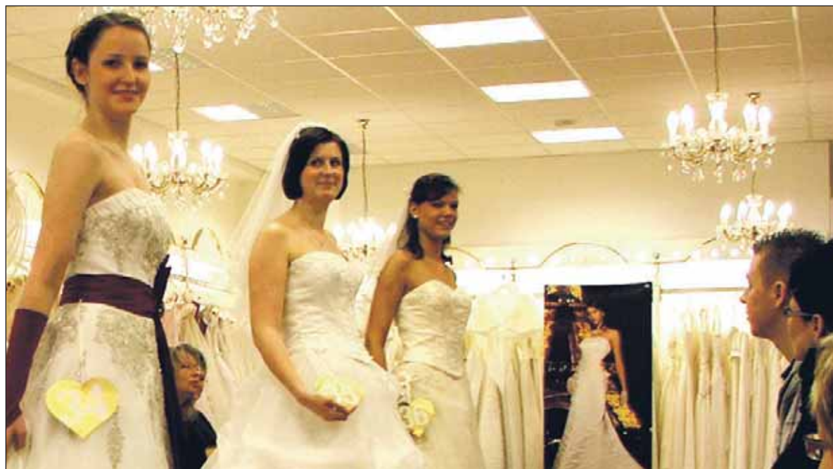
Eine wirkliche Pracht: für den schönsten Tag im Leben geputzte Models.

Nach der Schau am 7. Februar nun eine nächste Schau am 7. März