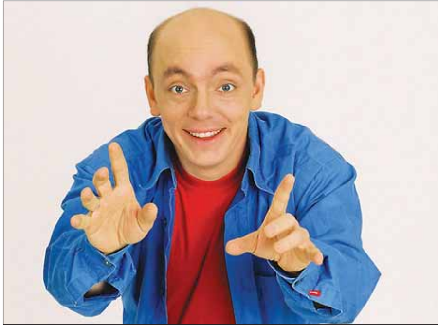
Kleiner Mann, großer Verstand: Am heutigen Sonnabend ist der Komiker Bernhard Hoëcker ab 20 Uhr im Capitol zu Gast.