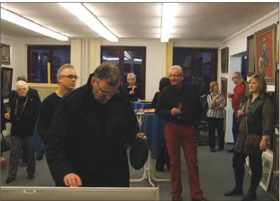
Zur offiziellen Eröffnung des Auktionshauses am 7. Februar fanden nicht nur Sekt und Häppchen das Interesse der Besucher, sondern vor allem die zahlreichen Bilder.

Über viele Jahre war die Hausnummer 13 des Schweriner Marktes als Buchhandlung bekannt, dann stand das Gebäude etwa ein Jahr lang leer, bevor hier am vergangenen Sonnabend offiziell das Auktionshaus Schwerin eröffnet wurde.