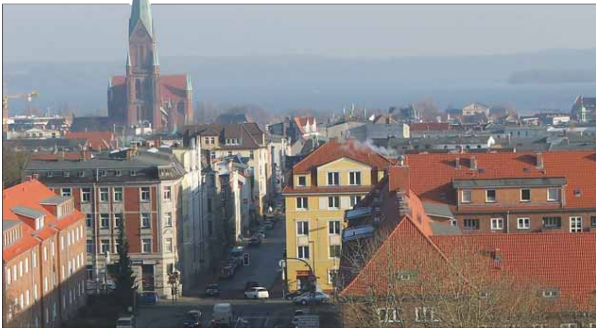
Schwerin soll nicht eingekreist werden.

Ab Herbst 2011 soll hierzulande neben Schwerin nur noch Rostock keinem Kreis angehören. Wismar, Neubrandenburg, Stralsund und Greifswald werden hingegen je einem der Großkreise zugeordnet, von denen sechs entstehen sollen: Nordwestmecklenburg, Südwestmecklenburg, Mittleres Mecklenburg, Nordvorpommern, Mecklenburgische Seenplatte sowie Südvorpommern. Es ist geplant, bestehende Kreise zusammenzulegen